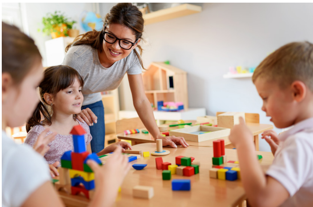
Foto: lordin - istockphoto.com/de (Agenturfoto. Mit Model gestellt.)

Bei der Förderung der Kinder muss ein Schwerpunkt auf Inklusion und Integration