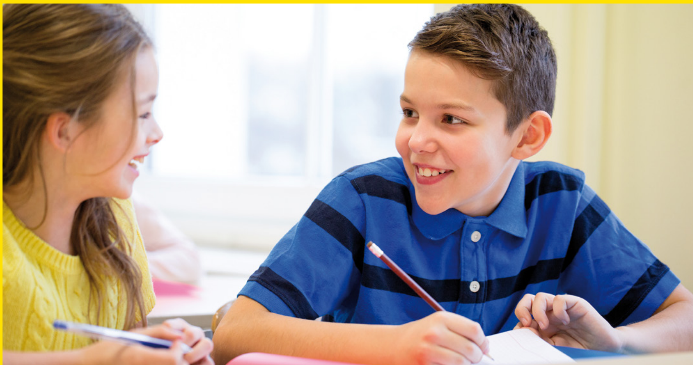
Foto: doigachov - istockphoto.com/de (Agenturfoto. Mit Model gestellt.)