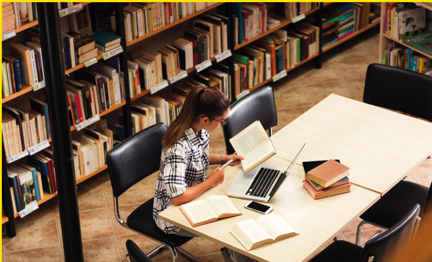
Foto: Zoran Zeremski - istockphoto.com/de (Agenturfoto, Mit Model gestellt.)