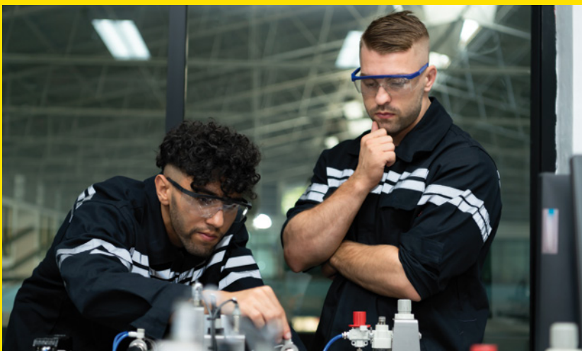
Foto: Sunan Wongsannga - istockphoto.com/de (Agenturfoto. Mit Model gestellt.)

Wir wollen den niedrighschwelligigen Zugang zu außerschulischen Kultur- und Bildungseinrichtungen wie Bibliotheken stärken. Wir setzen uns dafür ein, dass diese vollständig auf Gebühren wie Ausweis- oder Mahngebühren verzichten. Musikschulen müssen stärker durch Landesmittel unterstützt werden.